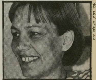
אילנה אלון, תובעת העולם הזה

היועץ סירב. לא בכל יום מופיע פרקליטת-מחוז אישית בבית-הדין. פרקליטת-המחוזות הם אנשים עסוקים מאוד, ומתפנים להופעה בבית-הדין רק במקרים נדירים ומיוחדים מאוד. עוד יותר נדיר שפרקליטת-מחוז מלמך סניגוריה על נאשם.