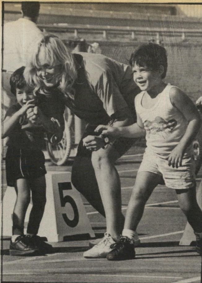
איל דסלת העולם הזה