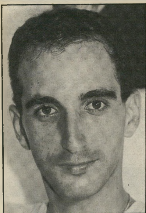
אני זסר, תעלים הזה