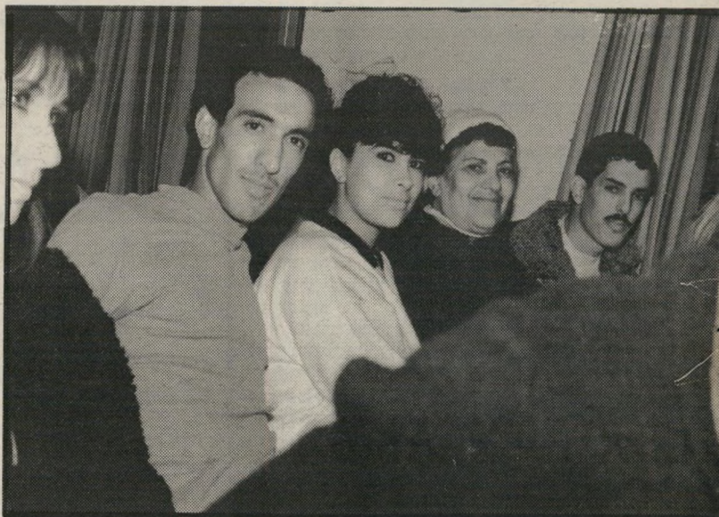
דרור בחוג מישפחתי פאזל על הקיר

בבית-החולים אמרו לי הרופאים שזה לא ויהם טיבעי, אבל לא האמנתי להם. ציודתי במשה לוי. אבל היו כמה פרופסורים בבית-החולים שזכרו את המיקרים הקודמים של משה לוי, כי הם היו מיקרים נדירים ומוזרים,