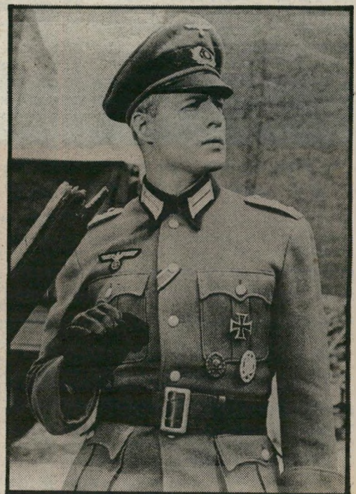
מרלון ברנדו בסרט "בפרי אריות" וכיום תיאבון מיני אדיר ללא הבדל מין נזע ודח