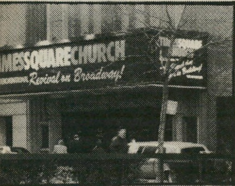
התיאטרון בדמותו הכנסיתית התנובות הכנסיה בפתח האחרון

בעת האחרונה אנו עוקבים בחרדה אחר השתלטות הדת על כל חלקה טובה בחיינו, ומתבוננים בדאגה רבה בהתעצמות כוחם של הקיצוניים הדתיים. מי שסובר שהזידק החרדי תוקף אותנו ואת שכנינו המוסלמיים בלבד טועה טעות מרה. הנגע החל לפני שנים, עם הגעתם של מיסיונרים דתיים אל כל המקומות שחזרה-האל על פני כדור-הארץ, ואל כל החברות האנושיות, הנחשלות והפרימיטיביות, בתואנה של אהבת-אדם ועזרה לנחשלים, כאשר המטרה העיקרית היתה, בעצם, הפצת הנצרות בעולם כולו. בדרך להשגת מטרה זו, אם אפשר גם