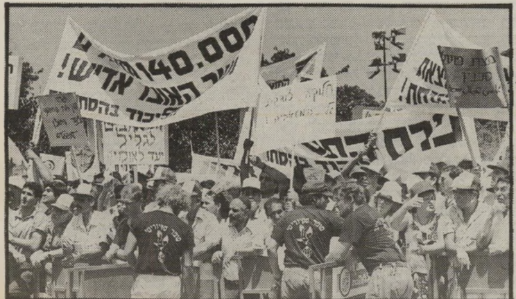
ציון צמירי, העולם הזה

התושבים היהודים שבשטחים מומן התנע"רו אף הם ולא יעורו אלף התנצלויות לאחר