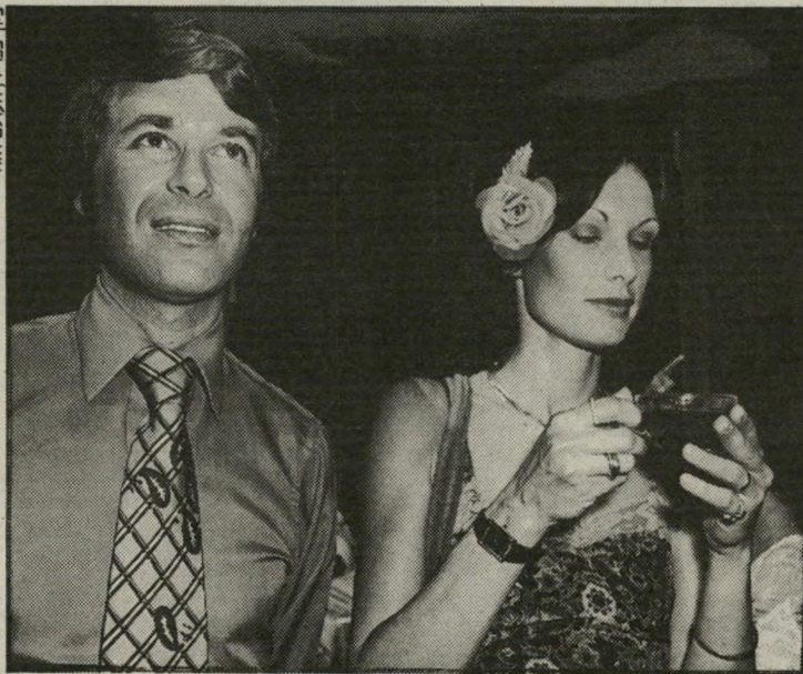
דפנה ודן כנר הרבה שברים שכבר קשה לאחות

זה כבר לא סוד שהנישואין של הקריין דן כנר ואשתו דפנה התרסקו, ויש כליכך הרבה שברים שכבר קשה לאחות אותם. מה כבר לא שמענו על המערכת המקוללת הזאת — מכות ואיומים ונאצות והשמצות ותלונות במישטרה, ומהכל לא סובלים בני-הזוג, אלא הילדים. אצל דן הרומאנים נעים בשדרת, ואם זיכרוני אינו מטעה אותי, אז היו לה כמה רומאנים עם רקדניות-ביטן. עכשיו, כשנמאס לו מהסיגנון המיוזר, הוא עבר לסטייל אחר. הוא מנהל רומאני עם בליינית תל-אביבית ידועה בשם מישל דרעי. היא התגוררה