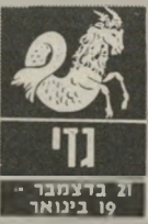
ג'מני 21 בדצמבר - 19 בינואר

בסקום העבודה קורים דברים חשובים. אתם עייפים, מרוגשים ובמיוחדים בצידקתכם. זה מביא אתכם להתעקש, לריב ולאבד, או, לה-דמות חשובה להתקד-מים יתכן שדווקא בי-חוכיות עבורכם, אלא שהוא חושש מהסז-הקטנון שלכם, ולכן כדאי שתורש את עצ-מכם. סמריכות עם עז-רים אי-אפשר להימנע. כל מה שקשור בהם מביא למתח. בחיי-האהבה, התנאי הצלחה הוא חשאיות.