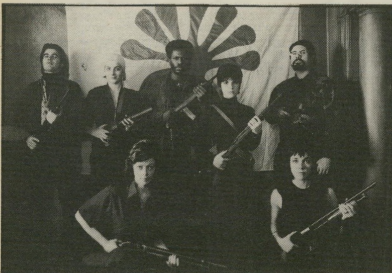
4. פטסי הרסט (ארצות-הברית)