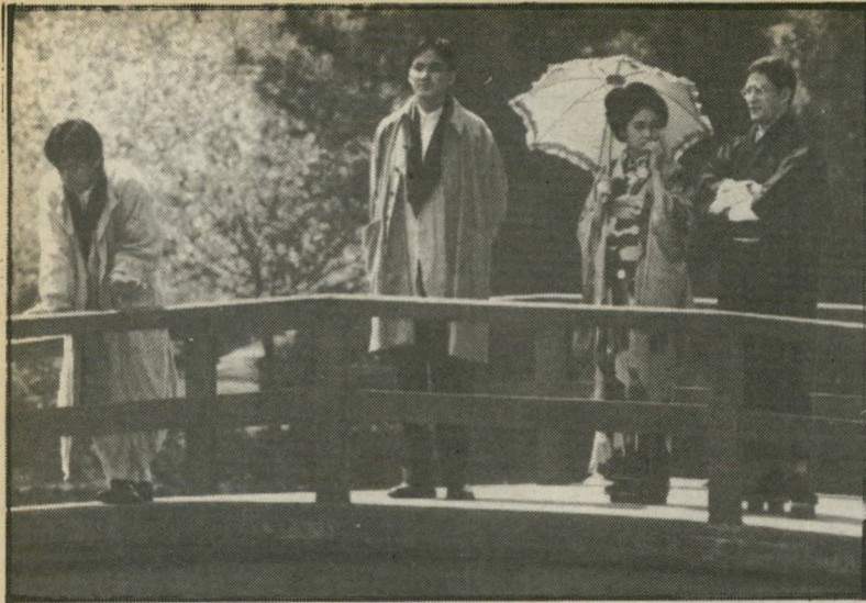
4. ואז (יפאן)