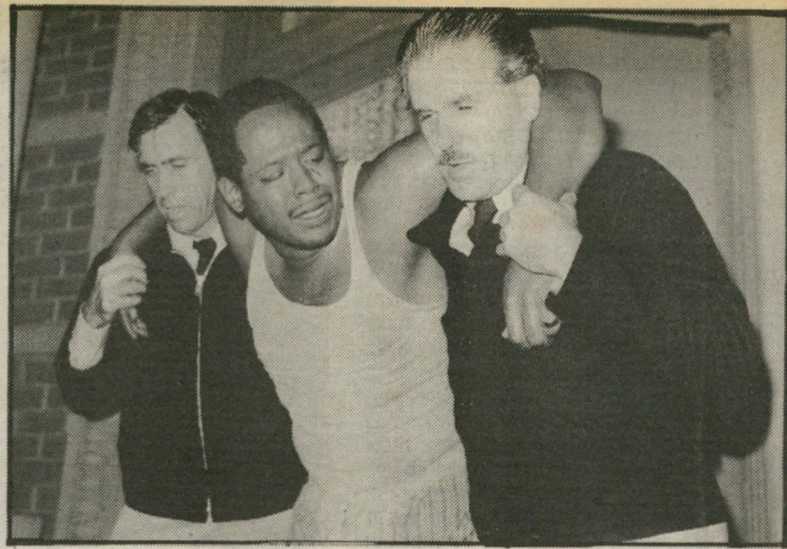
3. בירד (ארצות-הברית)