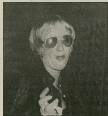
עיתונאית ברשם תופעה סדויה'ה בבחי'בושס

ובשבוע שעבר נתרצה סוף סוף מובארק לקבל לביקוריו את שר הבטחון יצחק רבין. אבל רק לאחר שהיה ברור לו מראש, ובעיקר באמצעות ארה"ב, שרבין מוכן לרונ במינוי נציגי אש"ף למור' עם משלחת ישראלית, תוך עצימת עיניים כאילו היו "נציגי השט' חים", או "נציגי חו"ל". כל זאת בניגוד לקויו היסוד של הממשלה, וללא שצער מרחיק לכת זה יובא לדיון בקאבינט או בממשלה, ולקול מחיאות הכפיים של אנשי השמאל ותקשורת