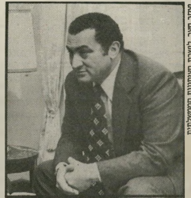
נשיא מובארק המוניח, זילוול ובוח לישראל

הארץ, בקו הרגיל שלו המתרפס כלפי הערבים, שיבח את מובארק על שפנה לעם בישראל מעל לראשה של ממשלתו. העתון