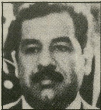
נשיא חוסני מלחמת הפתעה בישראל

ואילו רבין לאור אי יכולתו לעצור בעד ההרס והרצח של מה שמכונה אינתיפאדה, מנסה לכסות על כך ב"מהלך מדיני". בהבדל גדול אחר לפחות: ריין החזיר מלחמה שערה,