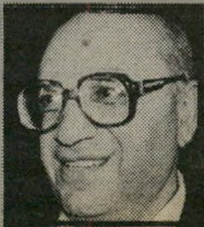
ציון צמיר העלים הוא