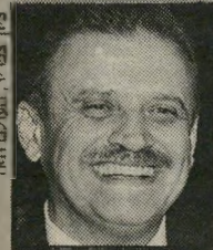
ציון צמיר העלים הוא

מטרת ההתארגנות היא גם להריץ את אלי לנדאו לכנסת, ולכנות מתחם את מעמדו של ח"כ שריר.