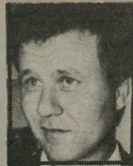
ציון צמיר העלים הוא