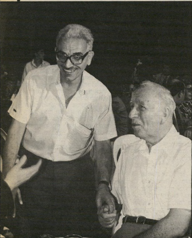
להיצת יד מזכ"ל-ההסתדרות, ישראל קיסר (משמאל), לא אהב את הרעיון שיצלמו אותו עם קודמו בתפקיד, ירוחם משל, אך אחרי הפצרות העיתונאים הוא הסכים.

בשולחן סמוך לשולחן שבו יש-בה ג'ואן ישב ידידה הקרוב, גוויין מורגן, שגריר ארצות השוק המ-שותף, שבאנגליותו הרבה נראה מנותק מהסובב אותה. לצידו ישבו שגריר צרפת, אלן פיירה ורעייתו תו ג'קלין, שכבר מאוד מעורים בחיי החברה בארץ ומרגישים בני-בית בכל מקום שאליו הם מוזמנים. בשולחן אחר ישבה ניצה לר-באיי-שסירא, אשתו כנפרד של חברה-כנסת דויד ליבאי, שישבה בחברת בנה החייל, דני.