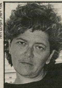
אלה זסה, תולס הוח

במשך כל השנה נראה המחזה הזה בערי ישראל: קבוצה קטנה של נשים, כולו לבושות בשחור, קיימו בכיכר מרכזית הפגנה שבועית שקטה נגד פעולות-הדיכוי בשטחים הכבושים.