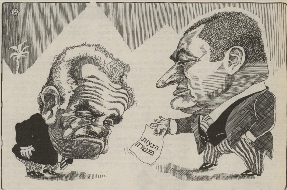
"אני לא רוצה לפגוע בך, הנשיא מובארק - אבל אתה כמעט גרוע כמו פרס!"