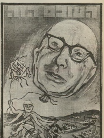
איש השנה תשכ"ז כלכנן ספיר