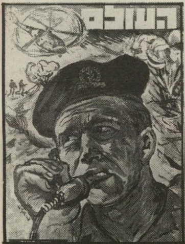
איש השנה תשכ"ב לוחם בפידאון רנב