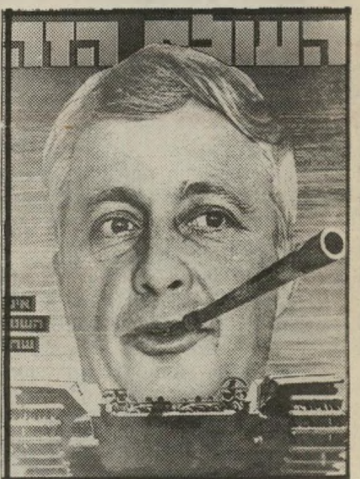
איש השנה תשל"ג מקיס תליכוד שרון