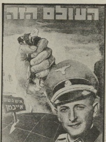
איש השנה תש"ד רכז עוואה אייכמן