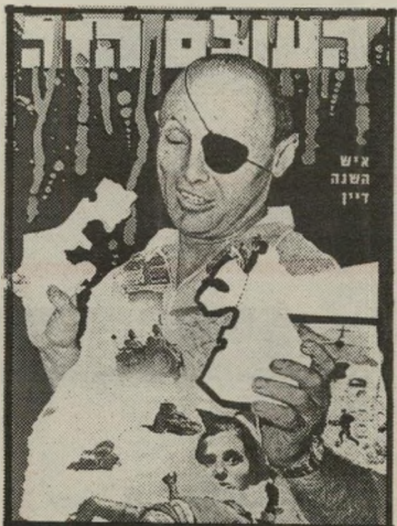
איש השנה תשכ"ז שרביטחון דיין