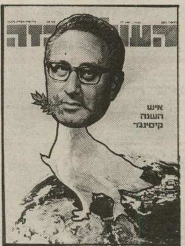
איש השנה תשל"ד מסדיר בניינים קסינגר