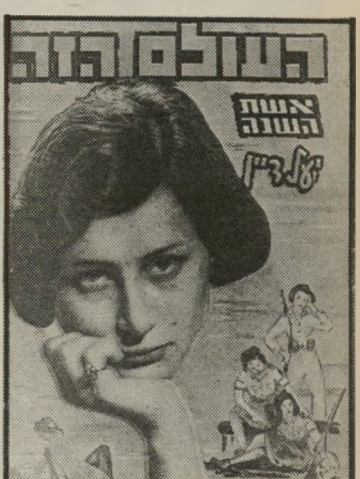
אשת השנה תש"ד סופרת דיין

זה הזמן להחליט סופית במי אתה בוחר. בשבוע הבא תוכל להשוות את בחירתך עם בחירת המערכת.