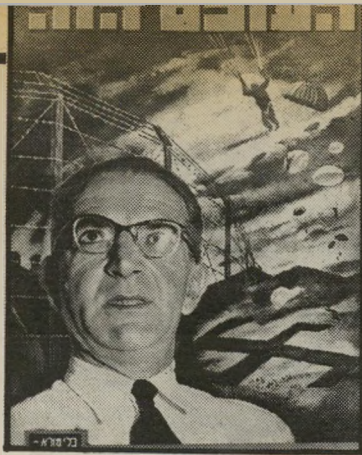
איש השנה תש"ד עסקן עוואה קסטור