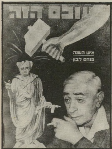
איש השנה תשכ"א מודח לבון