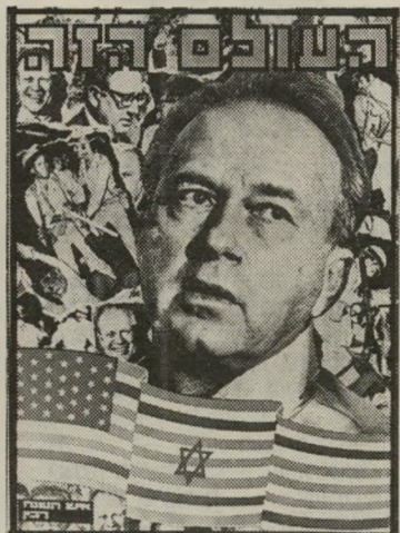
איש השנה תשל"ה ראש מסעלה רבין