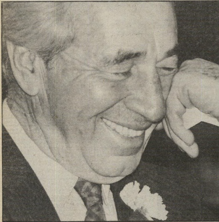
אמא: שר-אוצר שימעון פרס