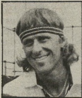
טניסאי בורג פרי הקשר: בן

נישאו ♦ במילאנו, איטליה, ביורן בורג (33), אלוף-הטנים השבדי (חמש פעמים רצופות אלוף וימבלרון) ולורדנה ברטה (38), זמרת-פופ איטלקית. אלה הם נישואיו