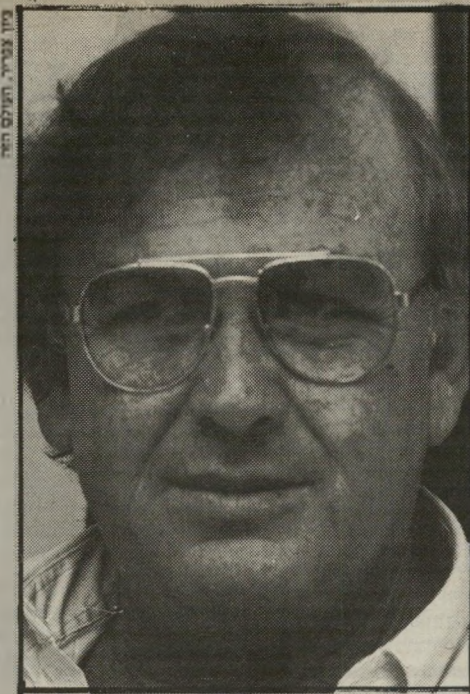
כיון סביר, תעלים הזה

אילו הייתי בעל הקבוצה, אילו זה היה עסק פרטי שלי,