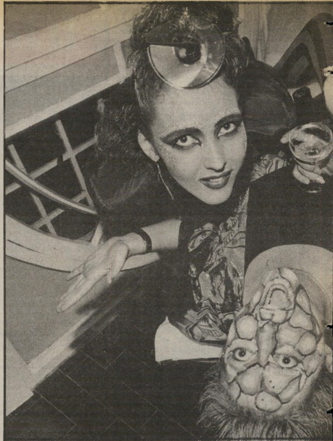
מין מפאריס", "בבושקה מרוסיה" ועוד. המאמר גיורא שביט משתמש בחומרי-איפור מיוחדים, כדי לכסות על צלקות מכערות שקרו מתאר-נות'דרכים, מפגיעות שקרו במהלך שרות-צבאי ומפציעות אחרות.