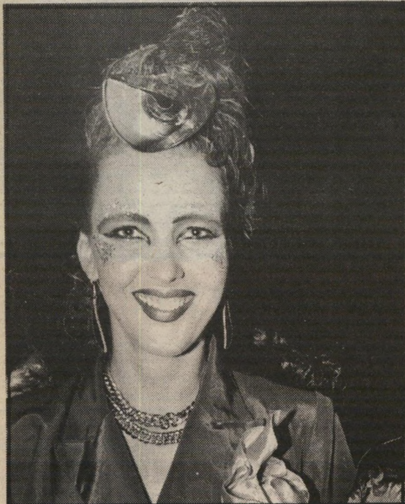
עולה חדשה אחת מהמאופרות היא עולה חדשה מאנגליה, שהתנשאה לגובה של 1.80 מטר. אחרי שהורידה את האיפור נתגלתה כהרבה יותר יפה.