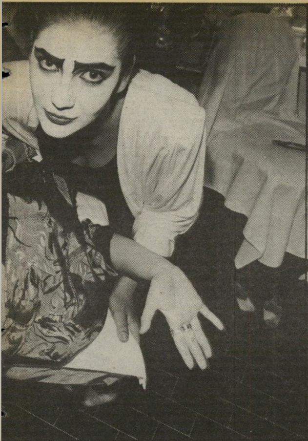
הצילו אחת מהבחורות המאופרות שוכבת על מיטה, כששתי בנות מאופרות רוכנות מעליה. הבנות, שהיו יפות לפני ביצוע היצירה המפוארת על פניהן, זכו בכינויים מעניינים כמו: «חתולת