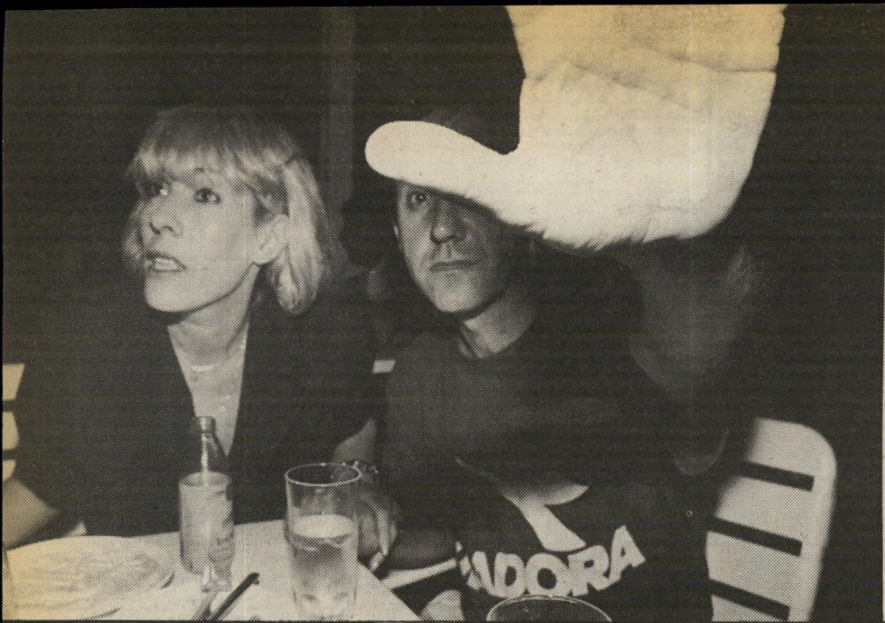
אלא זמית העולם הזה