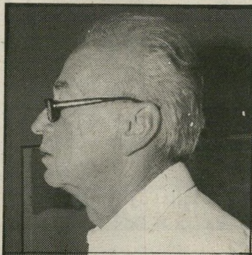
פרשן צבאי ומומחה לפסיכיאטריה קלינית

צ'מברליין וחבריו באירופה, אנסו דמוקרטיה שהיתה מעצמה צבאית כשלעצמה, צ'כוסלובקיה, להתקפל משטחי ההגנה החיוניים מול הטרור הנאצי של היטלר. כיצד התקפלות טריטוריאליות זו — למען "שלום עשוי" — הובילה לא רק לשיתוק וסירוס המכונה הצבאית של צ'כוסלובקיה, אלא לשבירת כושר ההתנגדות של אורחיה. עד שנפלו לא רק צ'כוסלובקיה, אלא העולם כולו — למלחמה. מעל לכל, באתו סרט טלוויזיה, לבני דור ישראלי שלא ידעו את אותה תקופה, בלטה דמותו של ראש הממשלה הבריטי, שנראה מין ליצן מבולבל, נפוח מחשיבות עצמית,