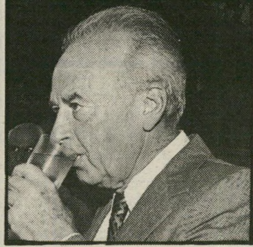
יתורים לפלשתינים כאמצעי להרגעת השטחים

הפולט שטויות חסרות טעם ונסוג מקו לקו — מול הטרור ההיטלרטי, כשכל שלב מוצג כהצלחה. המוני העם הבריטי התרגלו אז לשקט הזה של ראש ממשלתם ועתוניהם. פני אורחי פראג האומללים נחקקו בוכרון הצופה, כשנועד להם שמנהיגיהם מכרו אותם ואת עתידם לשגינות השלום של ראש ה"מעצמה הבריטית וחבריו. אבל אז היה כבר מאוחר. היהודים שהביאו לעולם את סיפור הגולם מפראג, זה שאינו אחראי למעשי הרס"נותו, ראו יחד עם הלא-יהודים, את תוצאות מדיניותו של הגולם צ'מברליין: ראש הממש