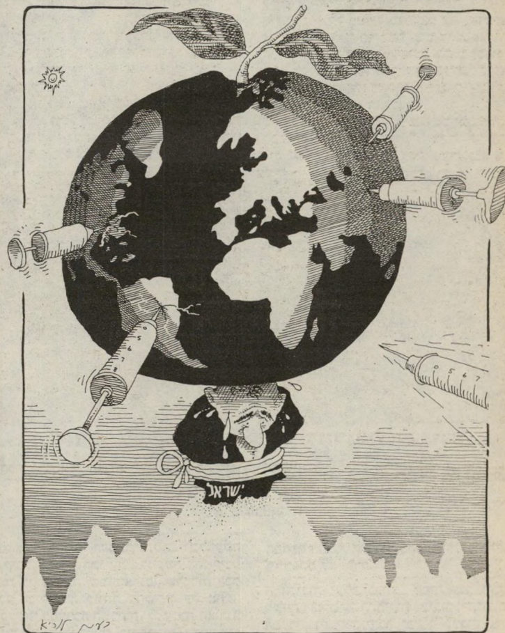
ועכשיו, תפקיד חדש: וילהלם טל