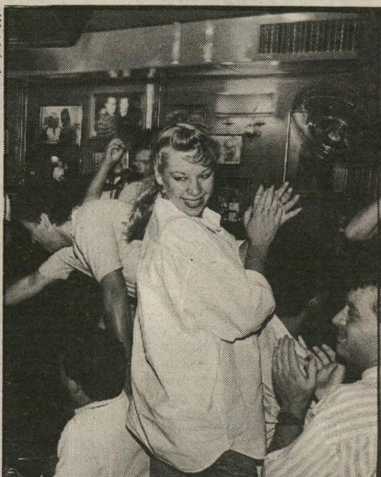
שרים, רוקדים ומחפשים

ובחצות מתחילים החיפושים. עוברים מבר לבר, מפאב לפאב, ומחליטים שהלילה לא הולכים לישון לבד. לילה בלי הפסקה בתל-אביב. (עמוד 26)