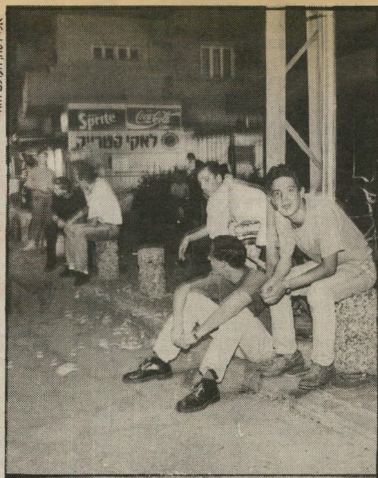
מחכים להסעה בחזרה לחולון