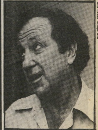
פעיל מוסה קס'ב'ק