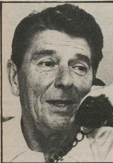
רגן הצליח בפעם השנייה

דוגמות אחרות הן ההתמודדויות הפנימיות במפלגות על המועמדות לכנסת. במערך, למשל, התמודדו 86 על מקום בכנסת, ובליכוד יותר מ-100. למעטים מאוד היו סיכויים ריאליים, ורובם ידעו זאת מראש.