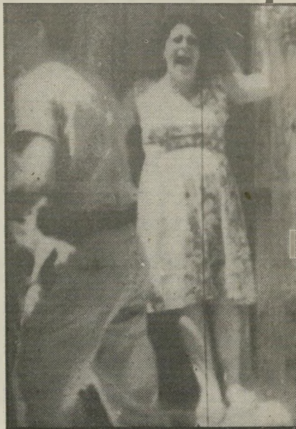
אשה זועקת בשעת הפינוי התקפה ברוסית