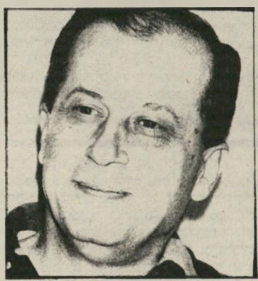
גנרל מישל עאון

כעניי רבים הוא דומה אולי לעכבר ששאג. אבל תביעתו היא בדיוק זו שנראתה כה חיונית לישראל בעת ובעקבות מלחמת לב-נון. ראש הממשלה דאז, מנחם בגין, חזר ותבע שהכוחות הסוריים ישתלקו מלבנון. לא רק למען לבנון רצה בכך בגין, אלא בראש וראשונה למען ישראל — כדי למנוע מתן