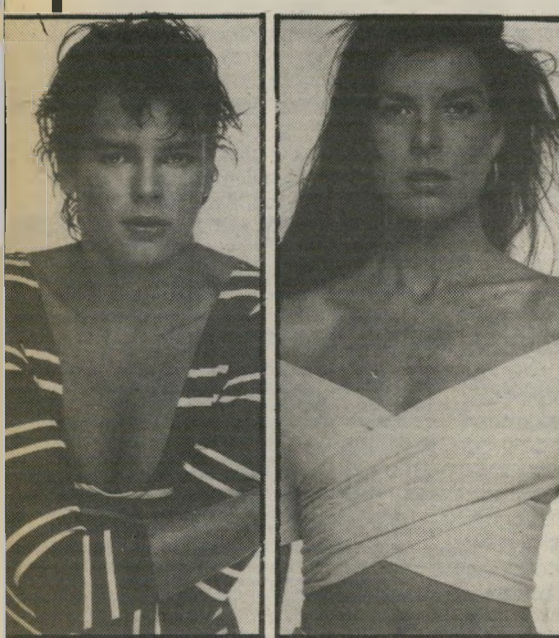
האחיות קארולין וסטפני ממונאקו. בראשות שזורות אהבות ושינאות — יוחר אמיתי משושלת

כיום היא משקמת את חייה בקליפורניה, וחיה עם מפיק תקליטים יהודי בשם רון בלוס, באושר יחסי. שמועות אומרות שהיא בהליכי־גיור, אני מקווה שהגיור יהיה כהלכה. אחרת לא תוכר יהדותה בבני־ברק, וזה בטח ישבור אותה. נו, אז אני צודק או לא? שושלת אנתנו צריכים? מונאקו היא הלהיט הבא!