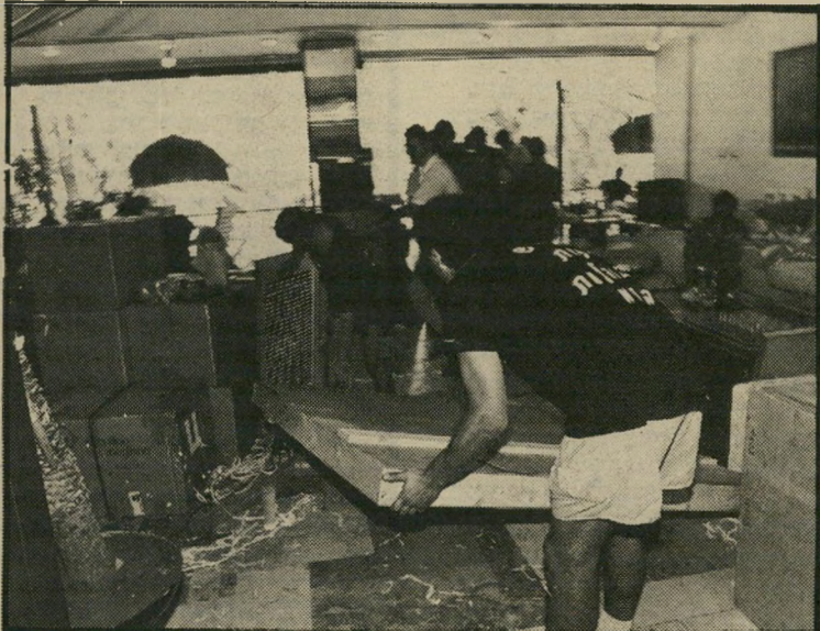
4. הכי כאב-הלב על התמונות. הורידו מהקירות את כולן והיו שם הרבה מאוד אורגינלים. 20 איש הסתובבו לי בבית שלי. הרגשה היתה כאילו מה שקניתי בכספי שייך להם ואי-אפשר בשום-אופן לעצור אותם.