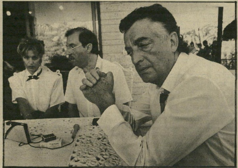
1. לא האמנתי. אחרי שברחתי מהצרפתים וסידרתי אתהאיטלקים ולחצתי את היד של בגין, אחרי כל זה הם באו לוויולה שלי ב-6 בבוקר, ולוקחים הכל בגלל חוב עלוב של חמישה מיליון דולר. ככה לעשות לפלאטו-שרון?