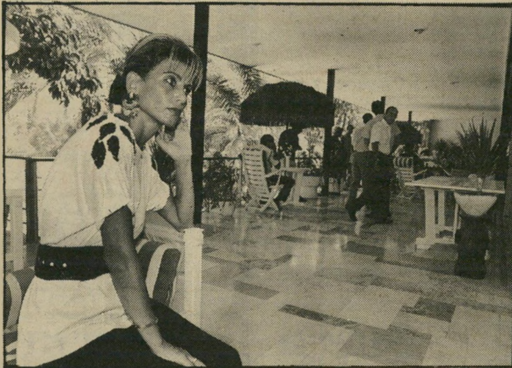
2. גם אנט לא האמינה. ישבה כל היום בצד ולא אמרה כלום, רק הסתכלה בעצב ובכעס איך החברת-גבייה הזו עם המישטרה נכנסים לתוך הווילה שלנו כאילו זה הבית שלהם ומוציאים הכל. איך היא תארה עכשיו?