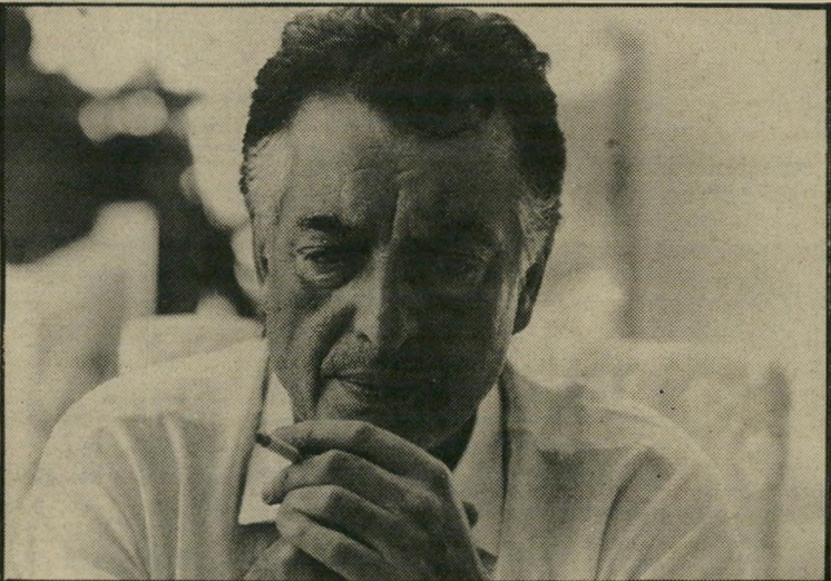
6. אז ישבתי לי בסוף בצד לבדי, ורק זכרתי את הימים הגדולים והטובים שבארץ הזו, ארץ ישראל, עשו כבוד לפלאטו-שרון. עכשיו אף אחד מכל אלה שידעו ללקק ולהתחנף לא בא לעזור לנו, לעצור את השוד הזה.