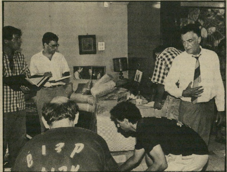
3. אמרתי להם: תעזבו, זה בכלל לא רכוש שלי, הצו שלכם לא חוקי ואמשר למתור איכשהו את הבעייה. אבל הם הסתובבו, הסתכלו, עשו רשימות ולקחו. חדר-חדר, רהיטרהיט, הם עברו, העמיסו ורוקנו את הבית.