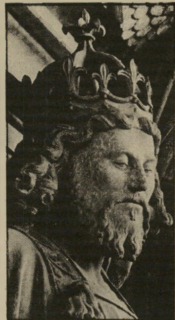
רודי המלך (קלאום סלוטר, 1400) ודבורה הנביאה צמאת-דם

לכן תיאר את דמויות התנ"ך כפי שמחברי התנ"ך עצמו הציגו אותן, ולא כפי שהן מתו-ארות על-ידי שטיפת-המוח הרתית המקור-בלת. לכן אמר מה שכל אחד יודע: שהתלמוד לא תם והושלם. התורה שבעל-פה הולכת