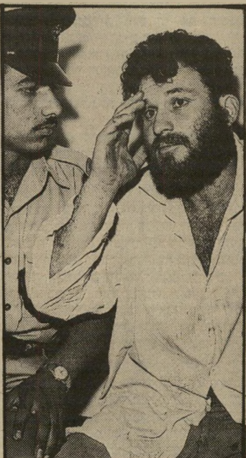
פרקש במעצר (1960) בישראל, האלימות סדרת

התעללו בי. ביקשתי לשבת לבדי באיקסים. (תאים מבודדים בכלא-אילון, שבהם ישבו אסירים ביטחוניים או מסוכנים.)