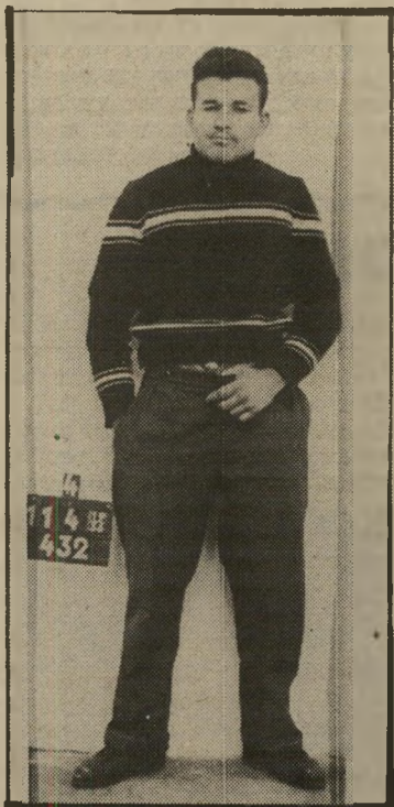
פרקש בתמונה מישטרית (1956) עו זה כמו אשה

לכלא הייתי בן 20 בשיא הכוחות שלי. הייתי עושה כיד כל היום, שופך זרע כמו מים, היה ממש נחל. התבודדתי בכלא, לא יכולתי לסבול אנשים אחרים. אנאלפתיים ופסיכיים