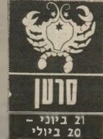
21 ביוני - 20 ביולי