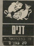
19 בפברואר - 20 במרץ