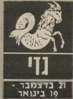
21 בדצמבר - 19 בינואר

בני הזוג של הגדיים שאינם נשואים נרמ"ים להם לאכזבה. הם מתנהגים בצורה לא הוגנת. חשוב לשוחח איתם ולא לזנוח. אל תשחקו מיני"חקי-כבוד. אם לא תאמ"רו ולא תעמדו על כך שייכבדו אתכם ואח הצד שלכם הם יתעורו. הם בהחלט זקוקים לחינוך ולחינוכות. עייפות רבה ביו ובכל בחודש. כי דאי שלא תתכוננו פני"רות מאמצה. פרויקט משותף בעבודה יכול לנרוע לכם בוש. זיכ"רו, שמכם המוב בפרויקט זה עומד במבחן.