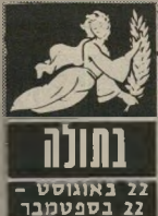
22 באוגוסט - 22 בספטמבר