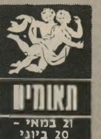
21 במאי - 20 ביוני

אתם מבוקשים על ידי המין השני. הופעתכם מושכת, ואנשים באים להתיעץ אתכם ולש"פוך את ליבם. אתם סת"כוונים לעזור ואף מצלי"חים בכך. אבל מתוך ידידות עומד להתפתח קשר מיי"חוק וזהו. אל תצפו לפרשיות אירי"כוחיות, אבל נצלו הי"כב את התקופה. הא"טנים שביניכם יצליחו מאוד עכשיו. כל מי ש"נבחן או עומד להתקבל לעבודה או ללימודים יעשה רושם מצוין. והסיכויים שלו נבזרים. נוחו ומפלו בעצמכם.