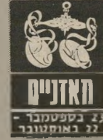
23 בספטמבר - 22 באוקטובר