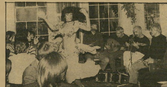
רקנית בטן בקפה „מוג'ור" קוסקוס, חומס, טחינה ופיתות

רים לנו חומס, טחינה, סלט גזר, עוד כמה צלוחיות, וכן פיתות. בתזוגי, שהיא צימחונית (אני חייב פעם למצוא לעצמי פרטנרית שהיא קניבלית, לשם שינוי), הזמיי' נה קוסקוס צימחוני, ומרוב התפע' אכל מה, מיסערה מרוקאית ב' ניורוק, זה אנתנו, בעצם. לא ית' כן, חשבתי לעצמי, שלאמריקאים יהיו המרוקאים שלהם. לקחתי אי'