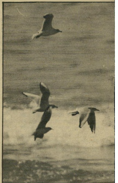
שחפים בטבע הצורה יותר — מקבל

הכמעט-תום של נערת-הקריאה די בו כדי לצודד את ליבם של כל מי שמזמינים אצלה שרות-קריאה. ואמנם, שילוב זה של שרות בעל שם מופקק עם פנים תמימות וגוף חושני של אשה הוא צירוף אידיאלי בשביל השופט-ברדמוס, המבקש ממנה לקרוא לו