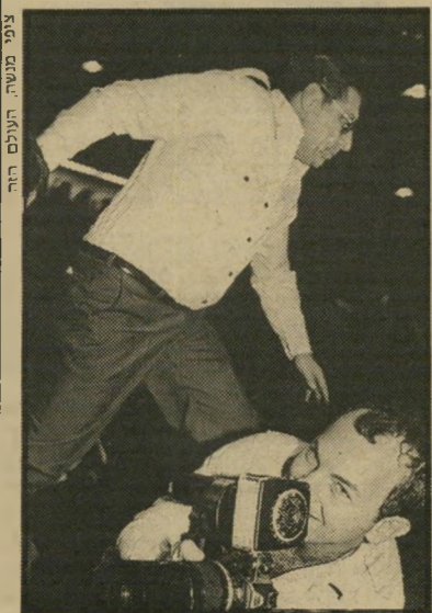
גנדי לקח את ההיסור