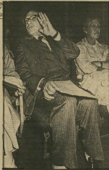
נאמן דבק בלי כריזמה

צריכות להיות שתי מיסגרות נפרדות: רתית וחילונית. למרות שמקרב הציבור הרתי קיבלה התחיה רק כ-10% מהקולות שלה, הרי שבסיעה בכנסת היה כוחם רב ומשורייני: 1 מתוך 3 (וחן פורת) בכנסת העשירית, 2 מתוך 5 (שפט, ולרמן) בכנסת ה-11, ו-1 מתוך 3 (ולרמן) בכנסת הנוכחית. אנשי הגוש נתנו לתחיה גוון שהרחיק אותה משכבות רחבות בציבור החילוני. בעיקר מצעירים רבים שהזדהו עם עמדותיה המדיניות, אך לא נתנו לה את קולם על רקע התסיסה נגד הכפייה הרתית, שהקיפה, והמקיפה גם כיום, את מרבית הציבור החילוני בארץ. הסברת התחיה, שהעדיפה להישען על טיעונים אמוצי-יוגליים ורתיים, היתה בעוכריה. אנשי הגוש נתנו להתחיה דימוי ציבורי משיחיימיסטי שמיקם אותה בשולי המחנה.