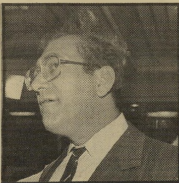
השר אולמרז לא ידע, לא שמע

לאחר הבחירות הכלליות המשיכו חברות הקש לגייס תרומות מתאי גידים, והצליחו לאסוף לקראת הבחירות המוניציפליות עוד כחצי מיליון שקלים. בכסף זה נעשה שימוש, בתשלומים לאגודלים במי יחד, במהלך מערכת הבחירות.