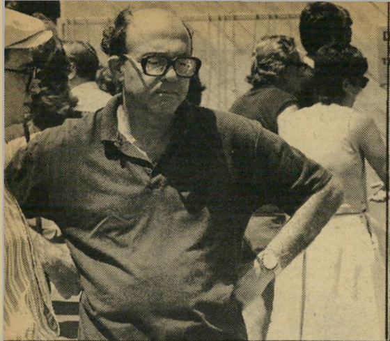
פורת בהלוויית תמוז מעניין. לא אמין