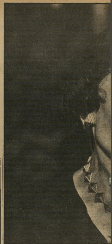
ג'ית של להקת-המחול בת-שבע וידידתה בלטה בשימלה שחורה בסיגנון צרפתי ילום למטה) מבקרת-המחול של „דבר“.

אחת ממי שנהנו מהתיקרות והפיקנטיות. הארכי-טקטית, בגופיה קיצרת-שרוולים, בלטה מאוד על רקע הסולידיות הירושלמית. עובדה שאולי תורמת לפופולאריות הרבה שלה.