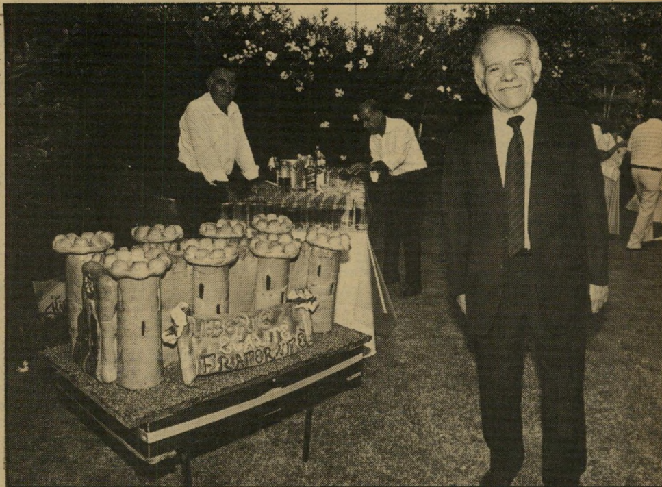
ציון צמיר, העולם הזה

יצחק שמיר ראש־הממשלה, היה בין אלפי האורחים שגדשו את מידשאות ביתם של שגריר צרפת אלן מיררה ורעייתה. שמיר עמד בסמוך לדגם קטן של הבסטיליה, עוגה שנשאה את סיסמת המהפכה הצרפתית: חופש, שוויון, אחווה. השגריר מיררה בפעולה דיפלומטית נייטרלית: מנשק את לאה רבין (למטה, מימין) ואת לילי שרון (למטה, משמאל).