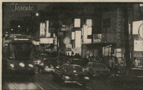
טורונטו — הרובע הסיני

כאשר באים בקבוצות גדולות, וכל אחד מוזמן מנה אחת ומתחלקים, החגיגה מושלמת.