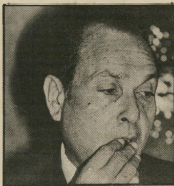
מודעי לא חסים

הדבר השני, שהיה יותר מדי ברור, לאד סוקד הוא, כי אין מי שחושב שהתוכנית של שמיר נוגעת באיוון רדך שהיא בשלום תוך מהתואר המופצץ, "יומת השלום" שהביק לה. איש אינו מתיימר לחשוב כי התוכנית עשויה להביא את השלום. אולמרט שיסה את יחסיהציוני שעשתה התוכנית למדינת ישראל בעולם. מודעי הגדיר אותה כסדרת עיניים למען העולם. ואף לא אוד הטיד את התוכנית כמיבצע, העשוי לקיב את השלום חשוב ושיכור ואת כל מי שתוקפים את השלום. כאילו הוא מתיימר להתחזק בסטם בגין, כמיבצע-שלום פרטי משלו. חשב ושיכור כולם: שמיר אינו בגין.