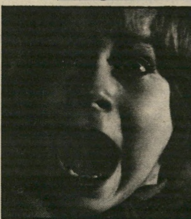
בלימודית מפחדים ילדים וגם את האשה

ר מלווייה הלימודית, שהפכה את ל ששת-השידור בין 2 ל-4 מרי יום שלישי, לשנת סקטים כנייני, התעלתה על עצמה, השטע בין בליל הסיטים על הנער הגדים, שתקי לאלוף בקפיצה לגובה, הנערה חשוכת-הפרס, שמבאק עם הכאב וכתה ככתו ה פריסה בלדיט, הנער, שבעת המשבר הכל-כלי התחל בארצות-הברית, הציל את חייה הסבבי שלו בעוד אמו גוועת ברעב, הביאה השטע גיטה הליחודית מוקדמת לסיפרו של צ'ארלס דיקנס דיוויד קופרפילד. ואי אפשר שלא להכתיב את הגירסה הזו בתואר הלהלום שסבטי. המיתקפה שעורך הסרט על כיסיהדמעות שלנו מנודה רק עם היכולת המופלאה הזו, של נער בשנת העשרה המוקדמת של חייו, לבסות במשך 130 דקות, כשצריך וכשלא.