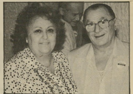
יוזר דוידס ונשיא גוראל מדעות והתמודדות

אגודת שים לב ללב (חיפה) היא עמותה ציבורית אשר נוסדה על-מנת להגביר את מודעות הציבור למחלות הלב, לדרכים למנוע אותן ובמקרה הצורך לדעת להתמודד עימן. שים לב ללב יוזמת פעילות ענפה כדי להקנות לאזרחי חיפה וסביבתה את יסודות ההיחייאה והידע הבסיסי בהצלת חייאדם במקרה של ארוע לבבי. כמו כן יוזמת האגודה קורסייה והדרכה מעשיים, הרצאות