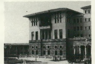
הקאזינו ומועדון הלילה

לא הרחק מאיסטנבול, על החוף המרהיב של ימת מרמרה נמצא פאר המלונות הטורקיים.