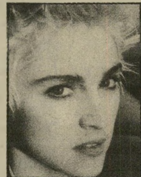
מאדונה להיות נזירה?

סיים בהמוניהם בארצות-הברית (ני" ליד הקופות), ערך עימה לאוממן ראיין, ובראיין הזה היא אמרה ש"ילדה, הייתה לא אוכססיה להיות נזירה. לא אחות או מורה. נזירה: או לא למות מצחוק; אבל, היא מוסיפה מייד שהאובססיה היו חלפה לה כאשר היא