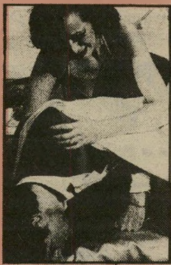
שחקנים אייטקן ואברט דיאלוגים חדים ושנונים

שבה שהה בפאריס, מביא משם אל הבית בלונדון את התלות שלו בסמים ואת ארוסתו. ביד אמן טווה קווארד את מירקם-היחסים השביר בין גיבוריו, ומביא את המחזה לשיאו הבלתי-ימנע בעימות מכאיב בין האם והבן.