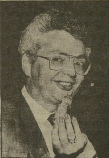
שכן זימנד היכו אותי בלסתו"

הפיליפיני אשם. זימנד כתב מיכתב לפלד, ודרש שבני-המיש'פה חייב יבקשו סליחה. פלד אמר שהוא עשה פרובוקציה, ושכמייוחד אשם