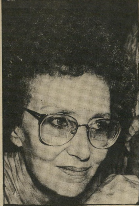
רוח אביר, תעלים חוז