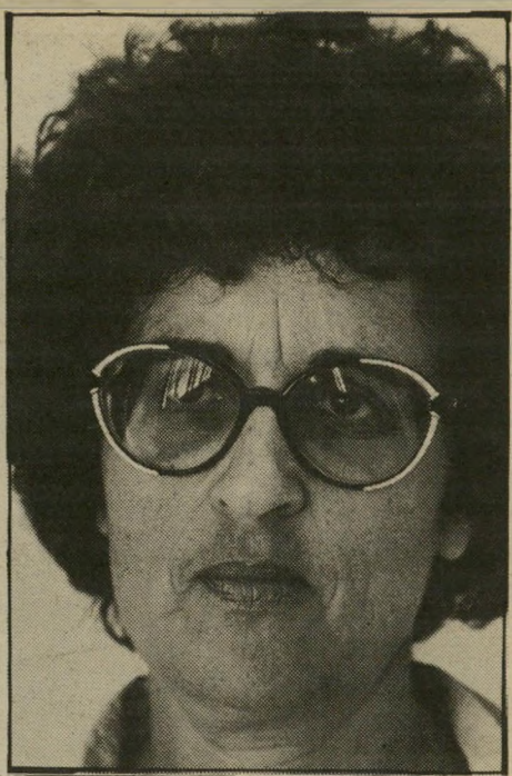
אילי דות, העולם החוץ

אנחנו לא מחפשים ניצחונות, אבל נדמה לי שבמיקרה הזה מדינת־ישראל ניצחה.