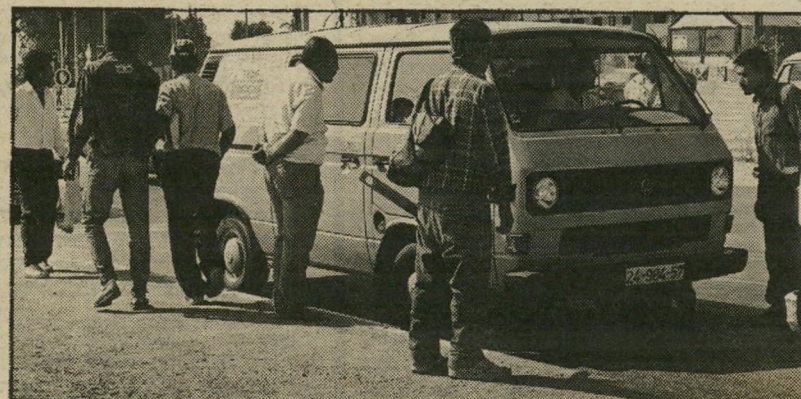
— לא רחוק מכאן —

הם לא באו. ישראל, כפי שהיא כיום, אינה ארץ המושכת עליה. כפי שנמסר השבוע רשמית, מבין 21 אלף איש שיצאו מברית-המועצות באחרונה, רק 2000 באו לארץ.