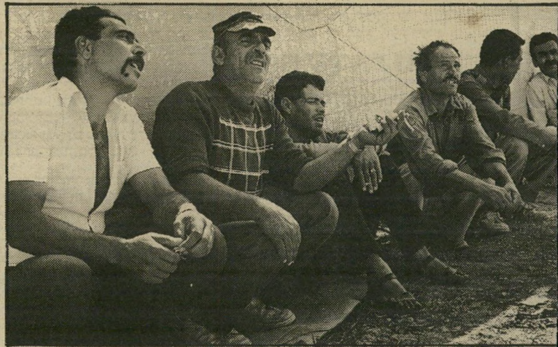
— אם ניכנס למיכלאות —

כך גם כל הצעותיו האחרות של רבין. לגבי הפלסטינים אין בהם שום שינוי של ממש. השינוי היחיד הוא כלפי מערכת-המישפט הישראלי. כיום השפעתה שולית. אם יתקבלו הצעותיו של רבין, השפעתה תיעלם כליל. המאבק באינתיפאדה כבר גרם להרס רב. נהרסו בתים, נהרסו הכלכלה הישראלית, נהרסו התיירות, נהרס שמה הטוב של ישראל בעולם, נהרסו הרבה ערכים בצה"ל. עכשיו תיהרס גם מערכת-המישפט. התועלת המעשית בשטח: אפס.