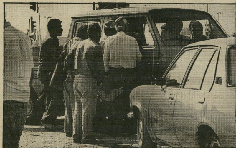
— כמו שעשו לפני שבוע —