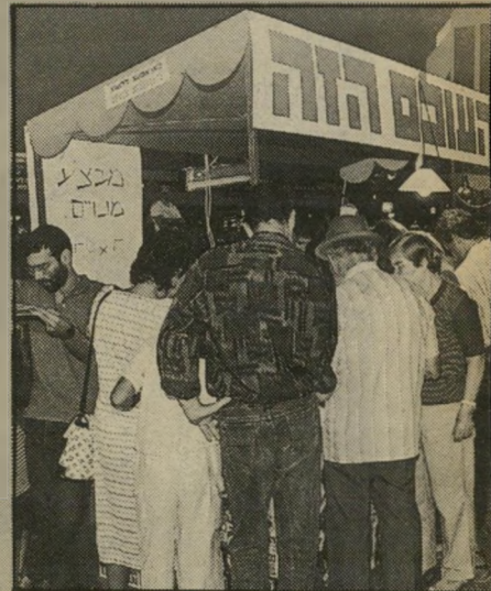
הרוכן ב"שבוע הספר" למה לא נישאה?

השינויים שחלו באחרונה כמתכונת ה- עולם הזה — הם רק בתחילתם — מעוררים סקרנות רבה. על כך יכולנו לעמוד השבוע כצורה המוחשית ביותר. כמיסגרת שבוע הספר, מיסג העולם הזה את הרוכן שלו ליד מדרגות בניין העירייה, ככיכר מלכי ישראל בתל-אביב. (בעבר בילי- תי כמקום הזה הרבה שעות, בהפגנות שונות.)