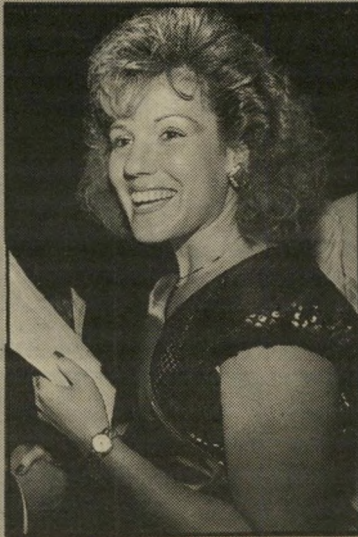
דנה ברק, תצלום הזה

תצלומיה של ענת סרגוסטי כבר הוצגו ככמה תערוכות — בין השאר בכינאלה הראשונה בעיר-חרוד ובתערוכת "הצילום