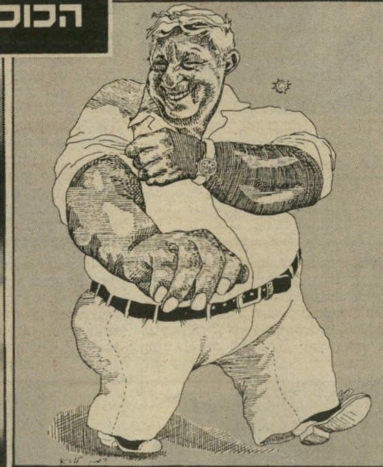
גרופר: מחפש חצי ליברל למרכז (11-10)