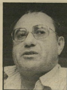
גורודיש רעב בגזונל (עמוד 43)